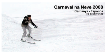
Carnaval na Neve 2008 Cerdanya - Espanha 2 a 8 de Fevereiro