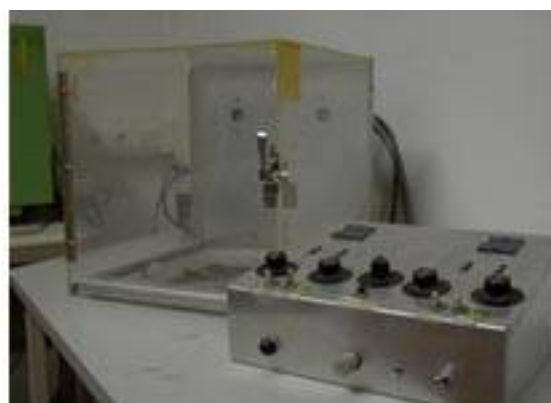
Caixa de Skinner com respectiva unidade de controlo para ensino