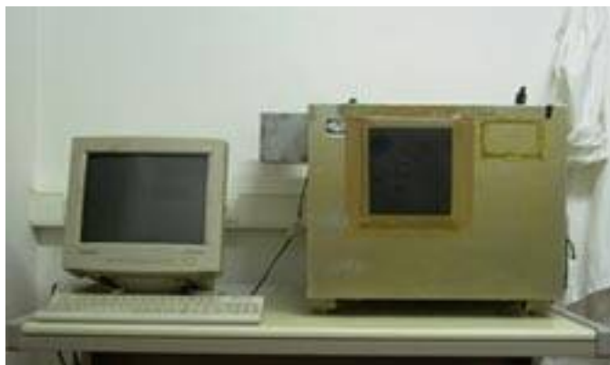
Computador e Caixa de Skinner standard